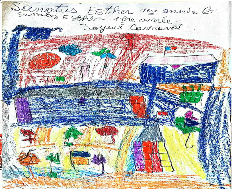
Dessins des écoliers lors du carnaval